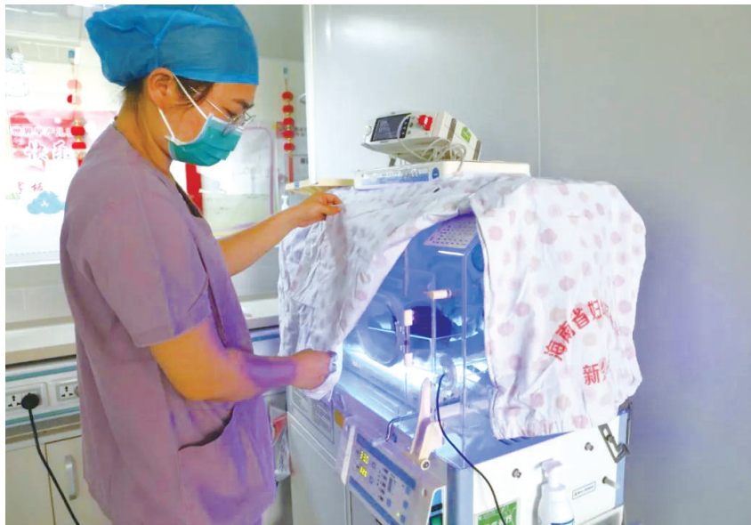
省妇儿中心新生儿科开设日间蓝光病房。

“癫痫中心”是适应现代癫痫诊疗模式的一种医疗组织结构,通过疾病诊疗的一站式和多学科协作模式,合理配置资源、优化诊疗流程,达到服务和疗效的最佳化目标。(张毓容)