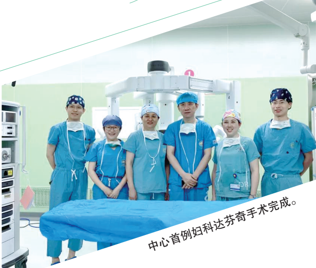
中心首例妇科达芬奇手术完成。

海南省妇女儿童医学中心妇科顺利实施了4例达芬奇机器人辅助下各式妇科手术,包括宫颈癌广泛性子官切除术+盆腔淋巴结清扫术+腹主动脉旁淋巴结切除术,全子宫切除术及卵巢囊肿剥除术。这标志着中心妇科肿瘤手术迈入智能化、精准化的微创新时代,也意味着中心妇科的微创治疗水平再上新台阶。