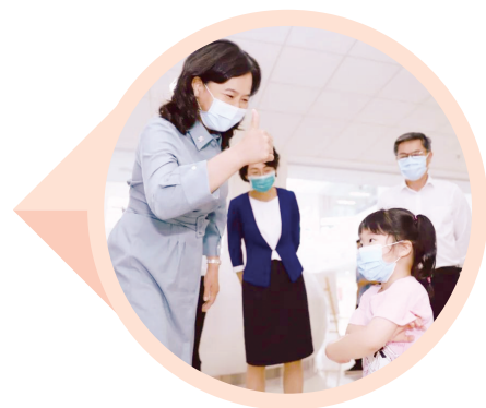
国家卫生健康委党组成员、国家中医药管理局党组书记余艳红与患儿亲切互动。

在听取了中心的发展情况和规划后,余艳红书记对中心的发展表示了充分的肯定,同时祝愿中心发展越来越好。(符王润)