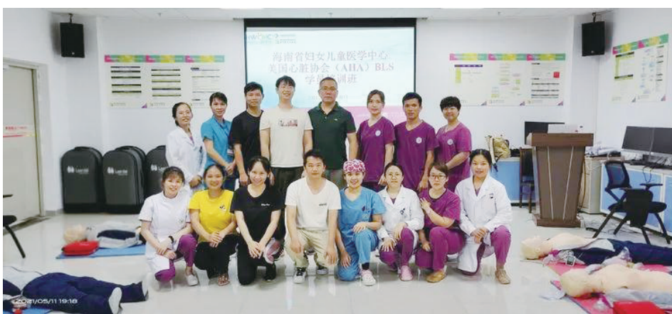
省妇儿中心举办2021年AHA基础生命支持BLS和高级生命支持PALS培训班。

培训期间,导师们认真负责,对学员严格要求,对每一项技能进行客观评估和反馈。通过导师团队及学员的共同努力,6位导师通过了资格论证,24名BLS学员通过5小时培训,12名PALS学员经过20小时培训,均顺利通过技能测试和理论考核。