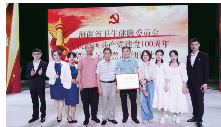
中心获评优秀组织奖。

为深入开展党史学习教育,抒发对党的无限崇敬热爱之情,4月30日下午,海南省卫生健康委员会在海南卫生健康职业学院大礼堂进行庆祝建党100周年暨“永远跟党走”朗诵比赛。委机关干部、委直属单位代表和海南卫生健康职业学院学生代表近400人观看了比赛。海南省妇女儿童医学中心参赛的诗朗诵《党啊,我想对您说》、《这个人》在24个节目中脱颖而出,分别荣获一等奖及二等奖,同时中心还荣获优秀组织奖,成绩斐然。(王宁)