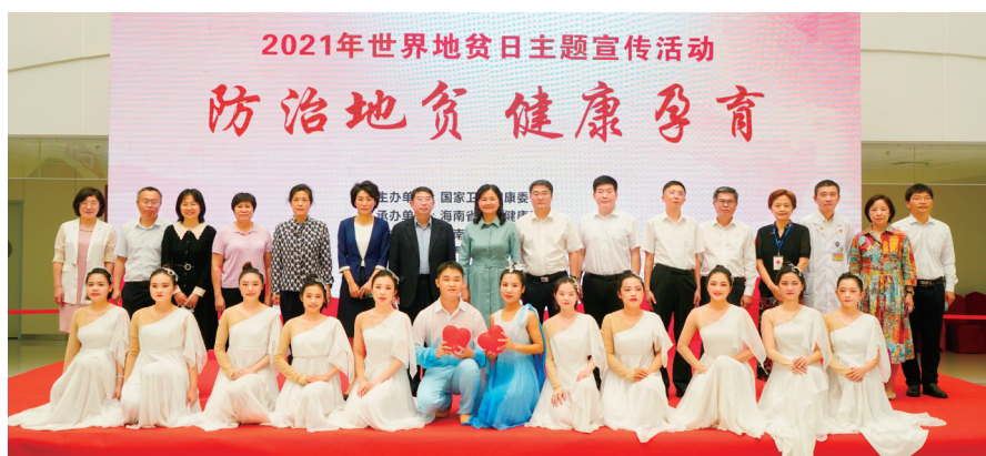
2021年世界地贫日主题宣传活动在海南省海口市举行。

生人口特别是黎族同胞出生人口健康最为严重的疾病之一。近年来,国家卫生健康委大力实施妇幼健康促进行动,就加强地贫防治和出生缺陷防治制定了系列政策制度,地贫防控试点项目、地贫患儿救助项目和出生缺陷防治人才培养项目在我省落地实施,并派出管理、技术专门团队指导我省地贫防控工作,为我省有效控制地贫提供了有力支持。他介绍,我省将地贫综合防治作为健康海南建设重中之重工作予以推进,尤其是2019年底,9部门联合出台《海南省地中海贫血综合防治十条措施》,我省地贫综合防治工作迈上新台阶。除了加强保障制度,我省还建立了筛查干预一体化综合防治服务体系;加大医保报销范围,不断减轻地贫患